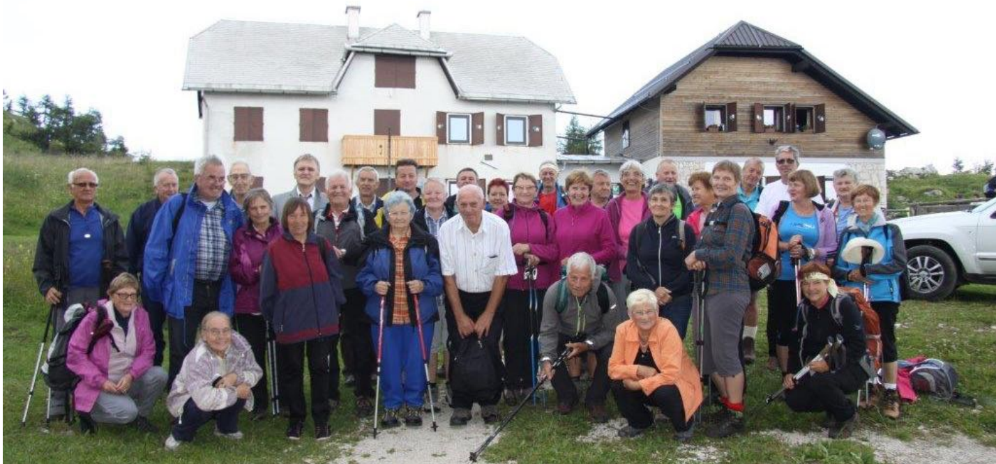
UTRINEK Z ROMANJA NA GORO